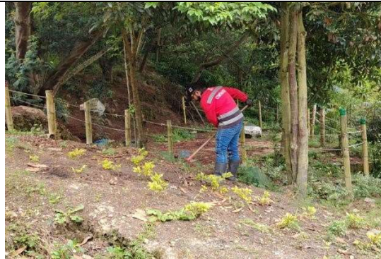
Fotografía 3. Limpieza y recolección de residuos