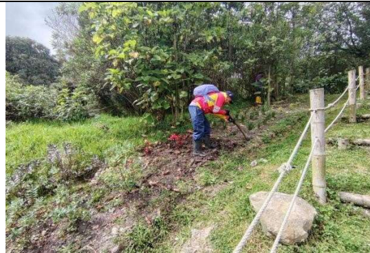
Fotografía 4. Remoción de suelo