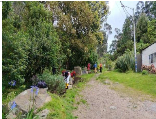
Fotografía 6. Punto intermedio de la actividad