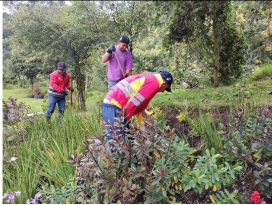
Fotografía 1. Deshierbe

No se presentan novedades durante la Jornada.