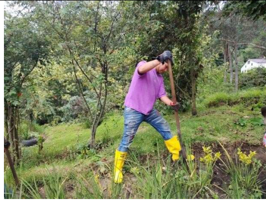
Fotografía 2. Bordeo