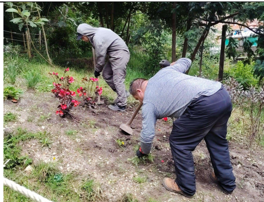
Fotografía 5. Deshierbe